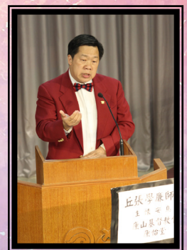
筆者在其母親的安息禮拜 分享信息時攝

對基督徒而言，前人對後人的教導，無論是身體力行的、言傳面授的、耳濡目染的，在其蓋棺後都有了定論。然而，其精意就是要具備《大使命》中所提及的教導傳承。因此，神學教育就是教會發展的基石，是需要弟兄姊妹全力支持的事工。你願意為此禱告嗎？你願意出資支持這項聖工嗎？