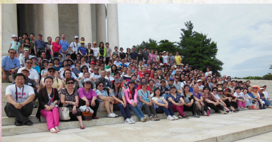
由紐約前往華府維護一男一婚姻制度的弟兄姊妹的合照

是的，婚姻需要好好強化而非從新定義；我們需要好好經營我們的婚姻而不再讓魔鬼有機可乘，藉夫妻的不和而使家庭受損、兒女心靈受傷害，以致對婚姻失望而被蠱惑去找另一條「出路」。作為神學教育的工作者，我們也要訓練一班能為真理發聲，能維護神所設立一男一女婚姻制度的工人，叫人從被強化的婚姻中看到神的形象！