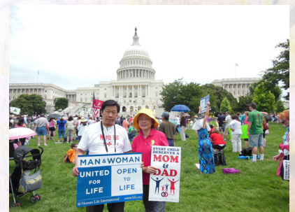
筆者與太太站在國會山莊的大草坪前舉牌維護一男一女的婚姻制度