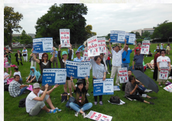
信徒都激動地舉起標語牌來支持這個活動